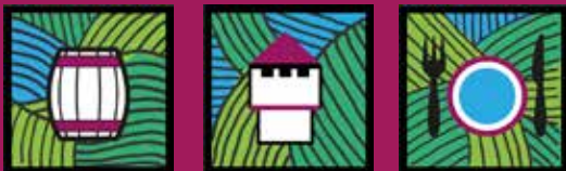
Pictogrammes de l'application numérique