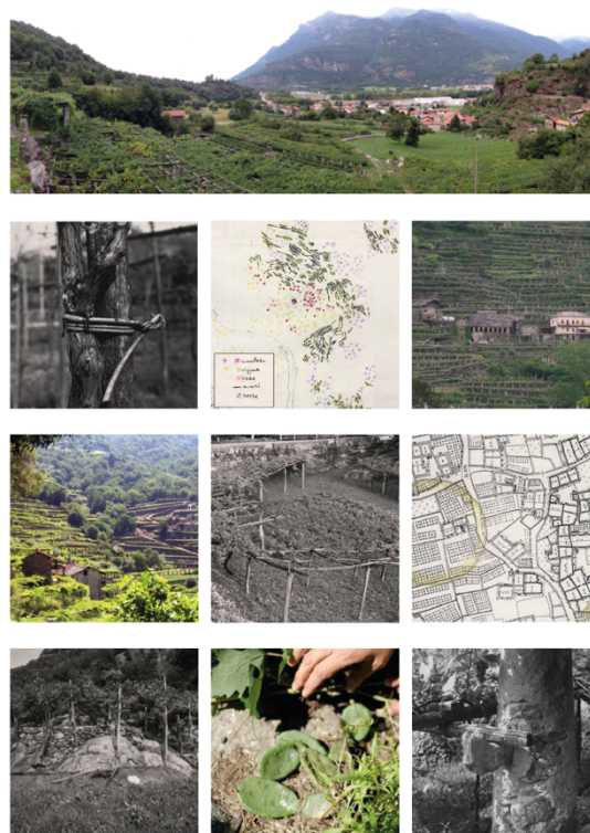
Figura 2 | I caratteri descrittivi del paesaggio viticolo alpino in Città metropolitana di Torino e un estratto dell'Atlante.