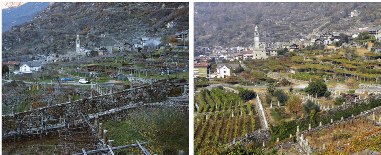
Figura 1 | Il paesaggio viticolo di Carema (TO) ieri e oggi.

Rispetto ai più noti ambiti viticoli nazionali e internazionali, in cui spesso è la perdita di biodiversità – e non di paesaggio – a preoccupare (Peano & Cassatella, 2012), i paesaggi viticoli alpini della Città metropolitana di Torino (CMTò) registrano una contrazione delle superfici destinate a vigneto che rende importante ed urgente la messa a punto di misure ed azioni mirate alla preservazione e valorizzazione dei caratteri paesaggistici che più li connotano. Inoltre, dove questi paesaggi permangono, le dinamiche di trasformazione non consapevole anche su piccola scala, possono via via alterare la matrice complessiva: non sono rari i casi di vigneti in cui, a seguito di interventi poco attenti all'identità del luogo, si assiste alla compromissione dei caratteri identitari del paesaggio [Figura 1].