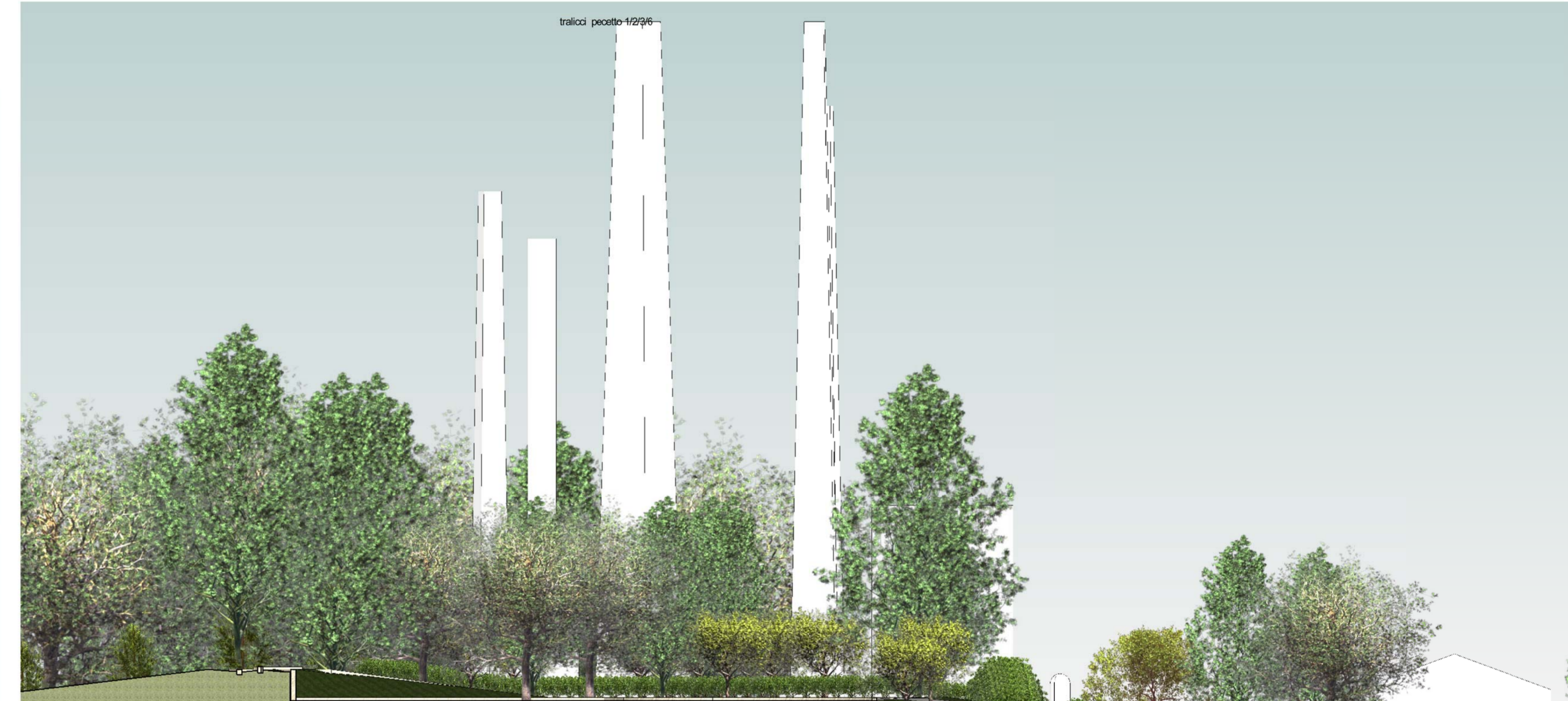
Prospetto 4 - a Scala 1:200