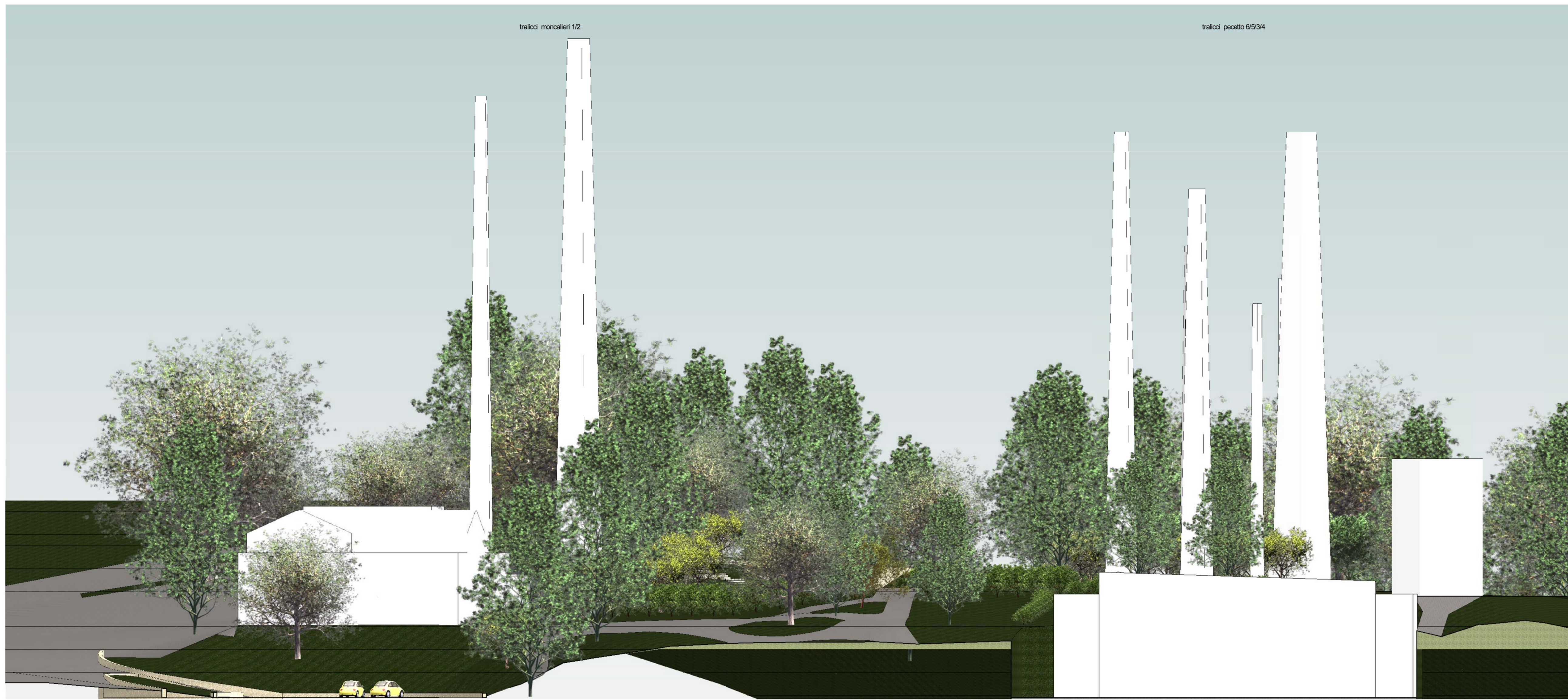
Prospetto Sud Scala 1:200