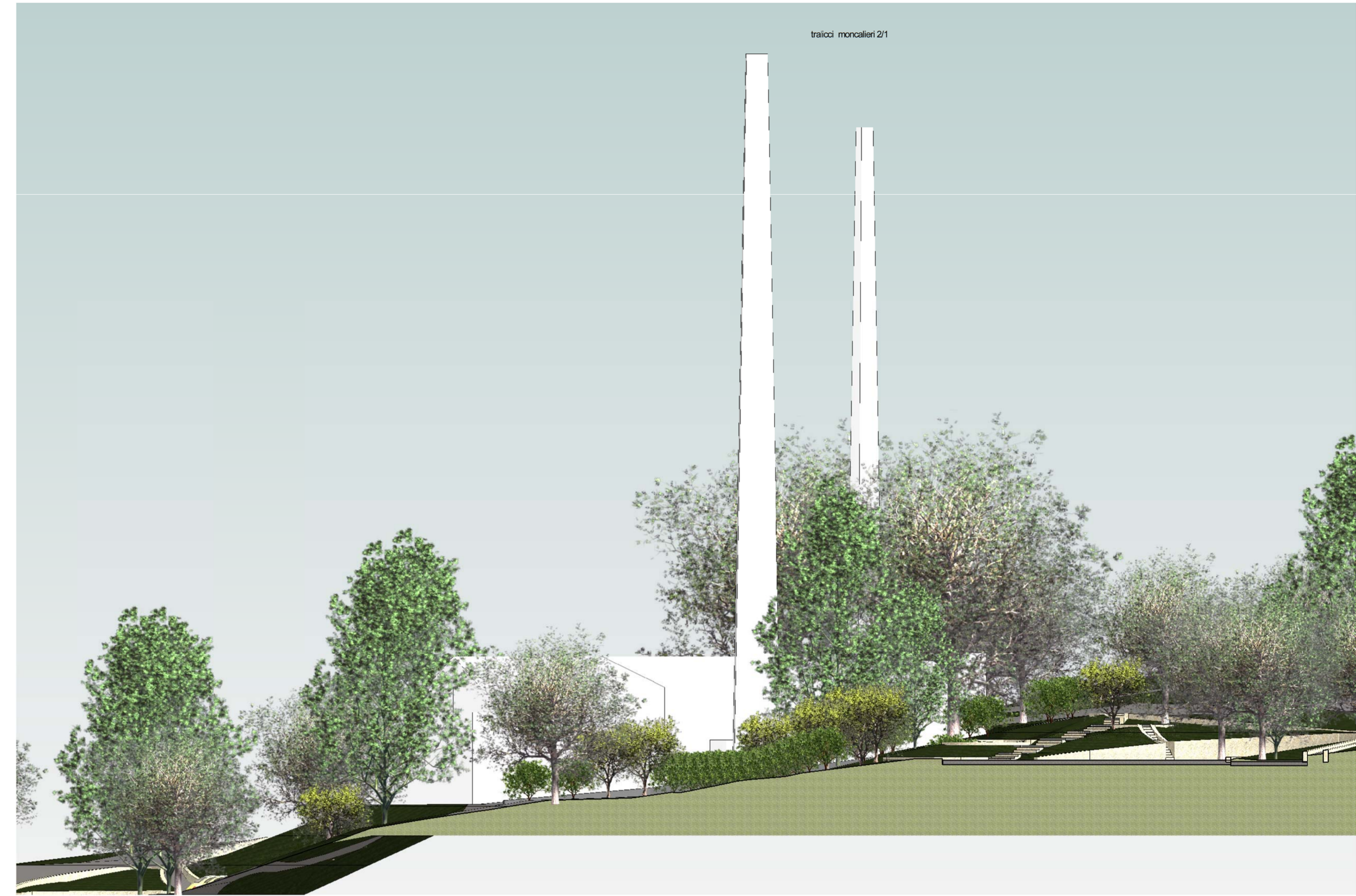
Prospetto 3 - a Scala 1:200