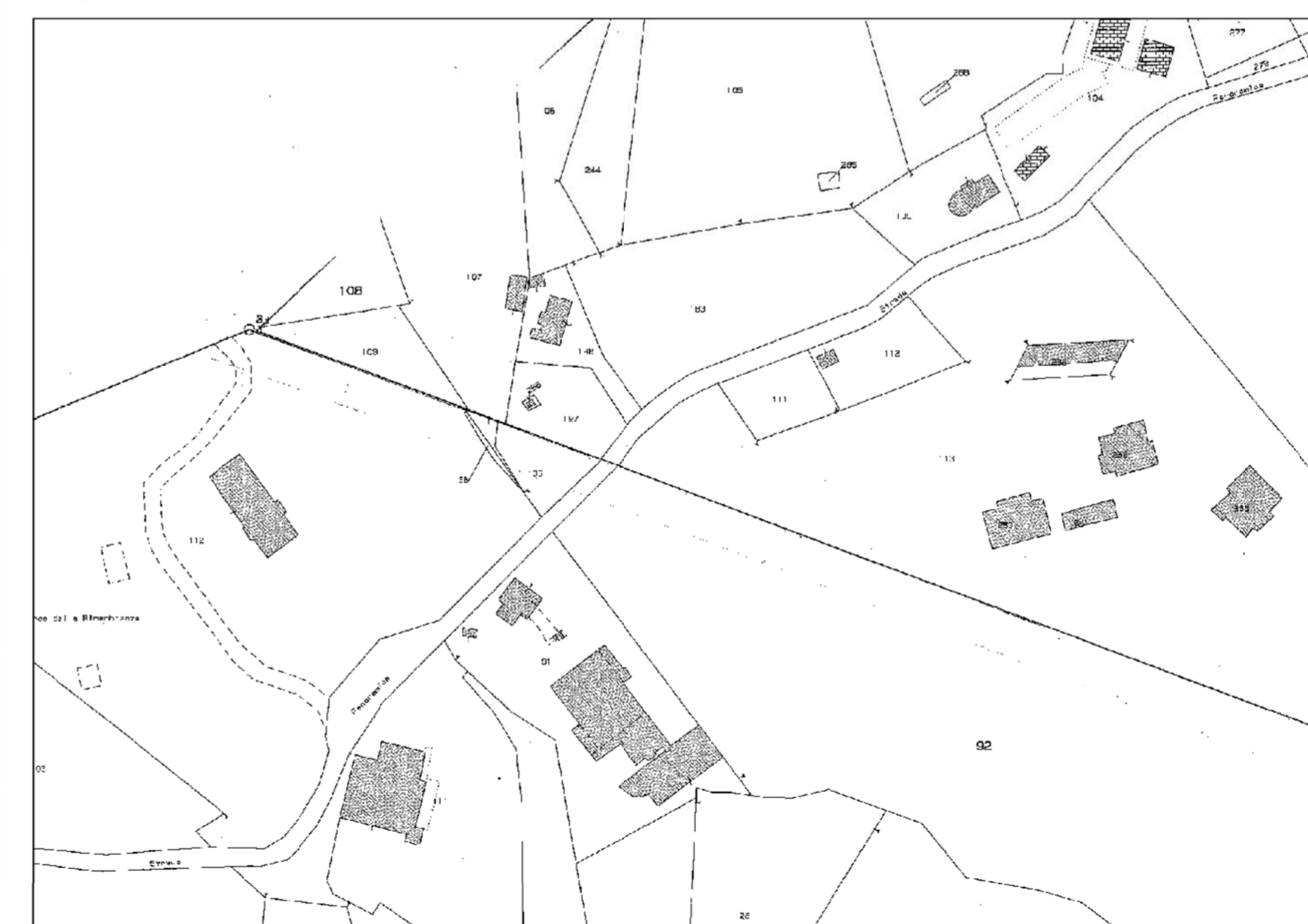
Estratto Cartografia Catastale Comune di Picozzo Torinese - Foglio 3 Mappale 102/109 Comune di Moncalieri - Foglio 2 Mappale 112