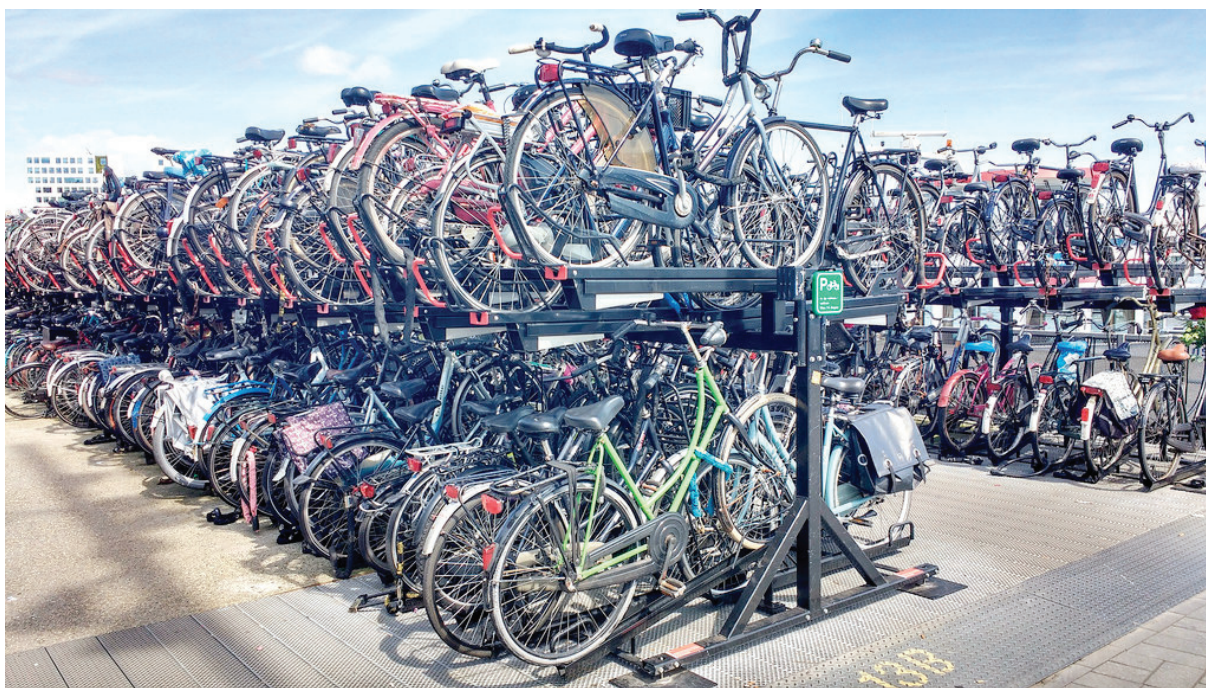
Bike Parking