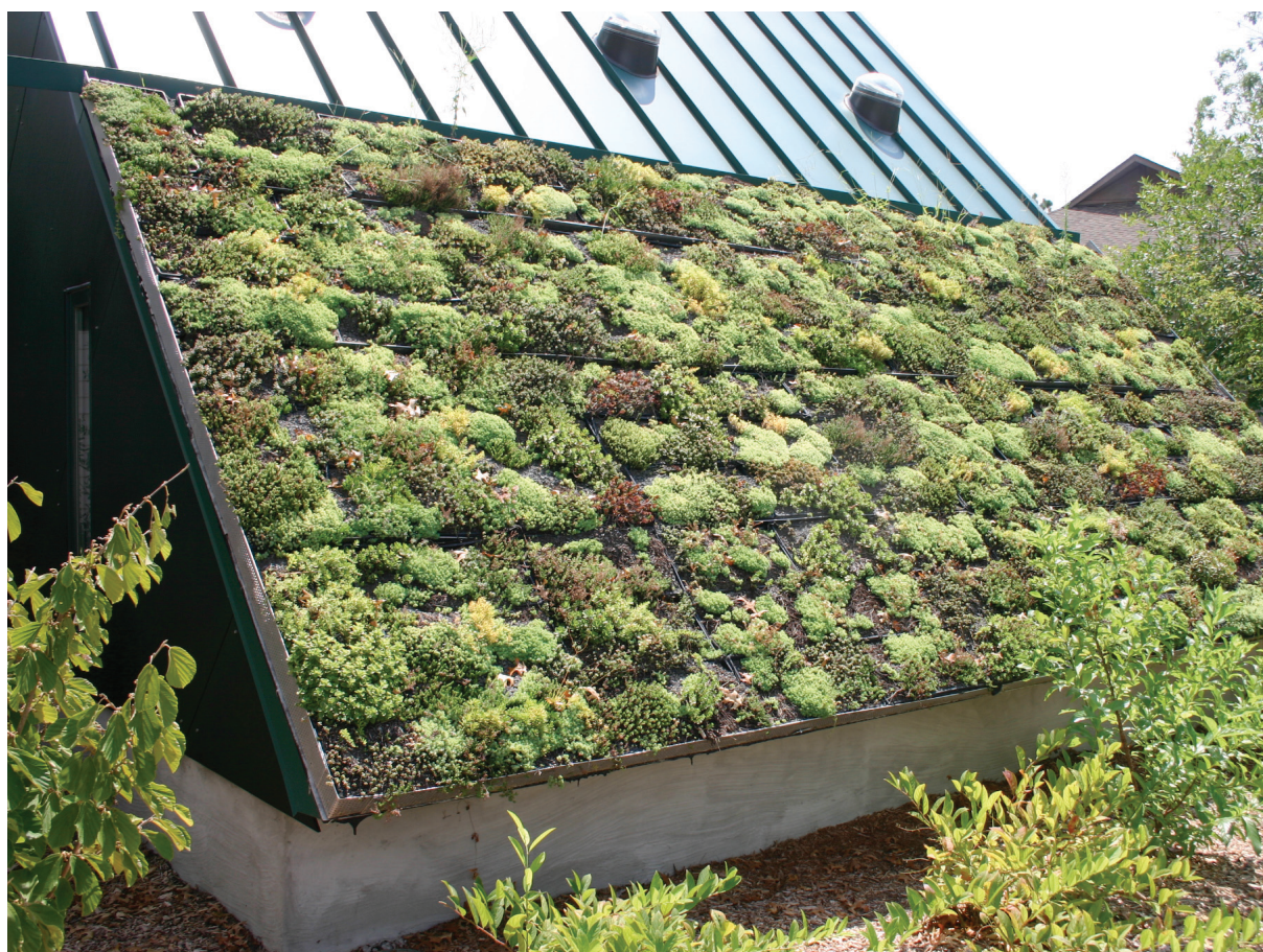
Edilizia Green

L'investimento in A.P.P. VER. per produrre conoscenze trasferibili in percorsi concreti di sperimentazione, e fondati scientificamente, va colto sia come aspetto tecnico di disseminazione per addetti ai lavori nei sistemi transfrontaliero, regionali e nazionali di entrambi i Paesi, che come opportunità di diffondere a grande scala e a un pubblico più ampio contenuti "green".