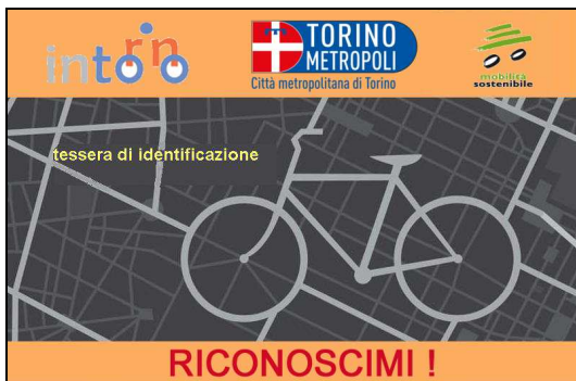
- Fig. 3 - facsimile fronte tessera -