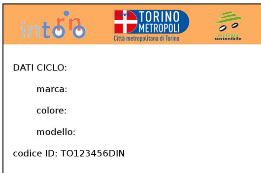
- Fig. 4 - facsimile retro tessera -