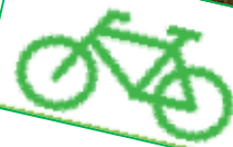
Parco Naturale Provinciale Rocca di Cavour