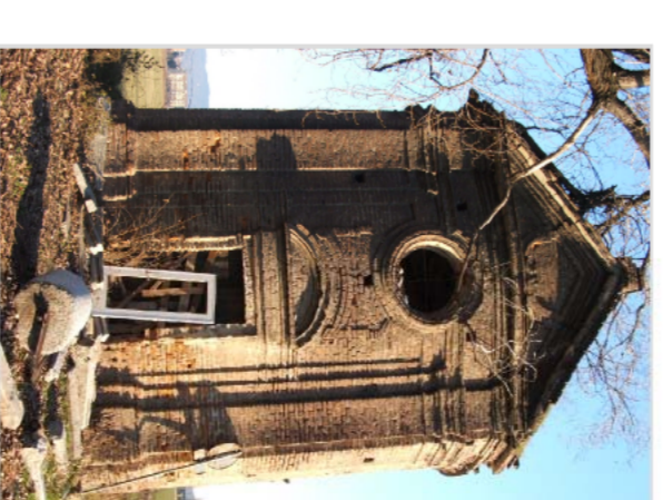
ASSESSORATO SVILUPPO SOSTENIBILE E PIANIFICAZIONE AMBIENTALE Area Pianificazione Ambientale e Sviluppo Sostenibile Servizio Pianificazione Sviluppo e Ciclo Integrato del Risparmio

APPROFONDIMENTI del PIANO STRATEGICO DI AZIONE AMBIENTALE (PSAA) NELL'INTERNO DEL TERMOVALIZZATORE Approvato con DDP n. 487-145874 del 23/05/2006