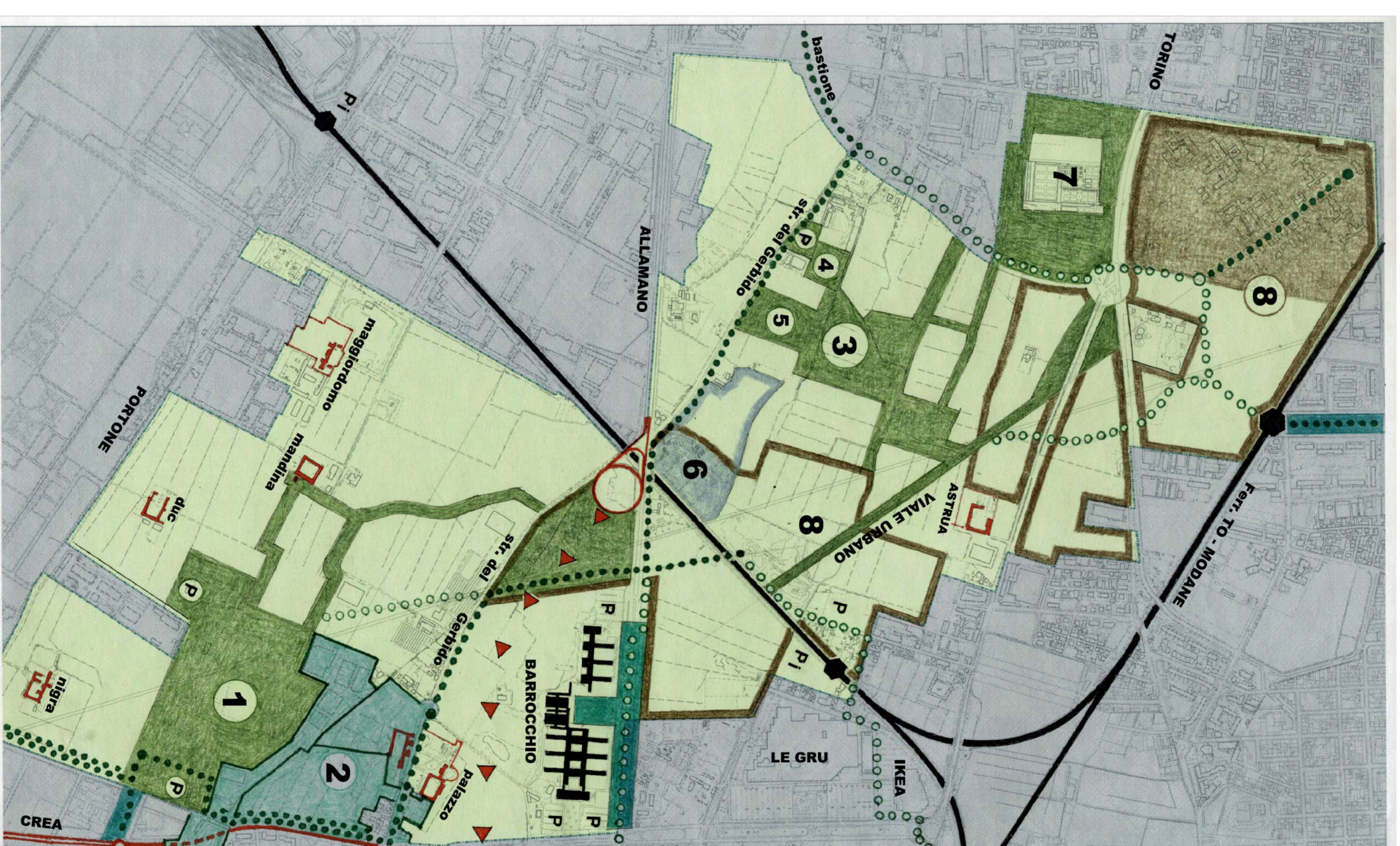
OFFERE DI COMPENSAZIONE COMPRESSE NEL PIANO STRATEGICO DI AZIONE AMBIENTALE (P.S.A.A.) CONNESSO ALLA REALIZZAZIONE DEL TERMOVALIZZATORE DEL GERBERDO • Aree del Piano Quadro del Sistema dei Parchi della Città di Grugliasco approvate con delibera di C.C. n. 69 del 19/07/03 • Aree da acquistare • Pista doposcuola in sede propria con abbeverata da v. Galliano a Villa • Chioschi passarella sul raccordo della F.S. Torino-Modane allo scalo di • Orassano; pista doposcuola del BASTIONE. • Forastore di schematura visuale del margine urbano • edificio rispetto al parco con percorso doposcuola • Fermane ferroviarie e parcheggi di interscambio