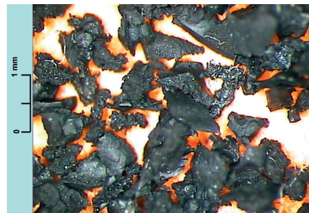
Immagine di un polverino da PFU acquisita con stereomicroscopio (ingrandimento 2.5X).