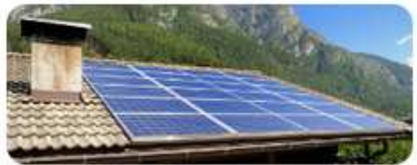
About the project