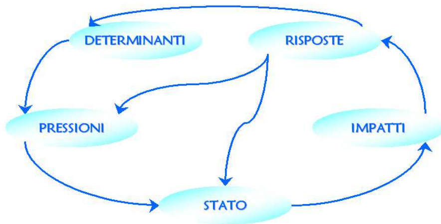
Fig. 3: Lo schema logico DPSIR.

A tal proposito occorre sottolineare la specificità del Contratto di Fiume quale insieme integrato di azioni volte al conseguimento dell'obiettivo dell'uso sostenibile della risorsa idrica, che non mette in campo forze che determinano pressioni ambientali, ma risposte volte a contenere gli effetti negativi di tali forze. A differenza dei piani e dei programmi che riguardano settori di attività che costituiscono di per se stessi forze determinanti e pressioni per l'ambiente, il Contratto di Fiume mira inoltre a tutelare una risorsa primaria, cercando di far sì che venga recuperata e riqualificata e riportata stabilmente a livelli di qualità e quantità soddisfacenti. Data la specificità del Piano d'Azione, ne consegue che l'analisi delle determinanti, delle pressioni e degli impatti secondo lo schema logico DPSIR si focalizza sulla componente acqua e sullo stato ambientale del bacino imbrifero, la cui conoscenza approfondita rappresenta il primo e fondamentale passo per la gestione integrata delle risorse idriche, in un'ottica di tutela, riqualificazione e sostenibilità ambientale.