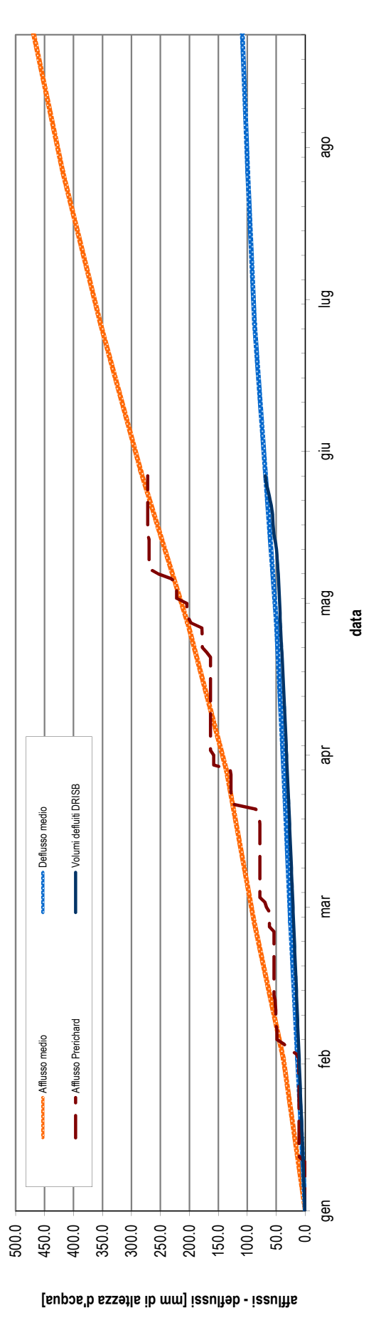
Diagramma cumulato degli afflussi e dei deflussi da inizio anno, espressi in mm di altezza d'acqua rapportati all'intera superficie del bacino idrografico contribuyente. L'afflusso medio di pioggia è relativo all'intero bacino dal 1995 in poi; i dati dell'anno in corso sono valori puntuali letti sul pluviometro di riferimento. Il deflusso attuale è misurato su DRISB, quello medio deriva dalla media delle portate mensili misurate su DRISB negli anni precedenti dal 2009 in poi