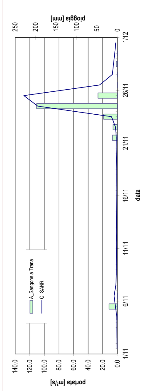
Portata registrata presso la stazione SANRI nel mese in corso, a confronto con le precipitazioni misurate presso il pluviometro di riferimento