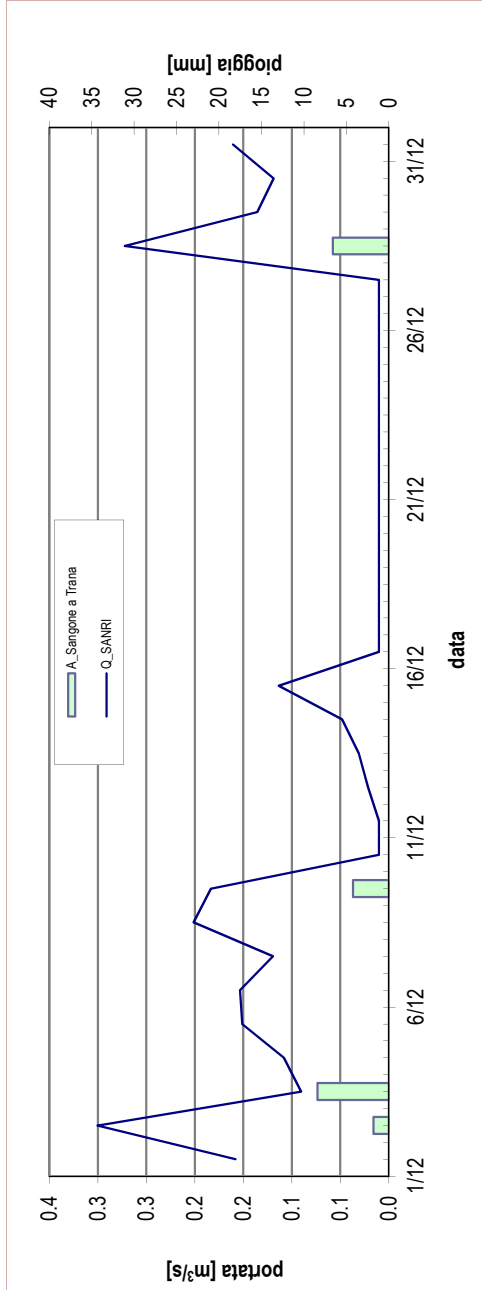
Portata registrata presso la stazione SANRI nel mese in corso, a confronto con le precipitazioni misurate presso il pluviometro di riferimento