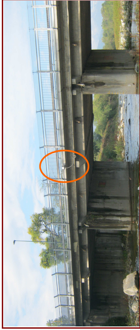
Fotografia della sezione di misura

I valori "medi" fanno riferimento ai dati storici di osservazione, quelli "attuali" sono stati registrati dalle stazioni nell'anno in corso.