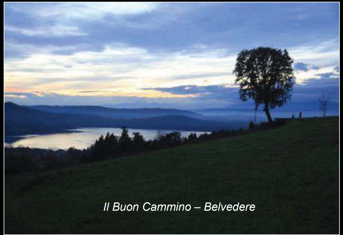
Il Buon Cammino – Belvedere