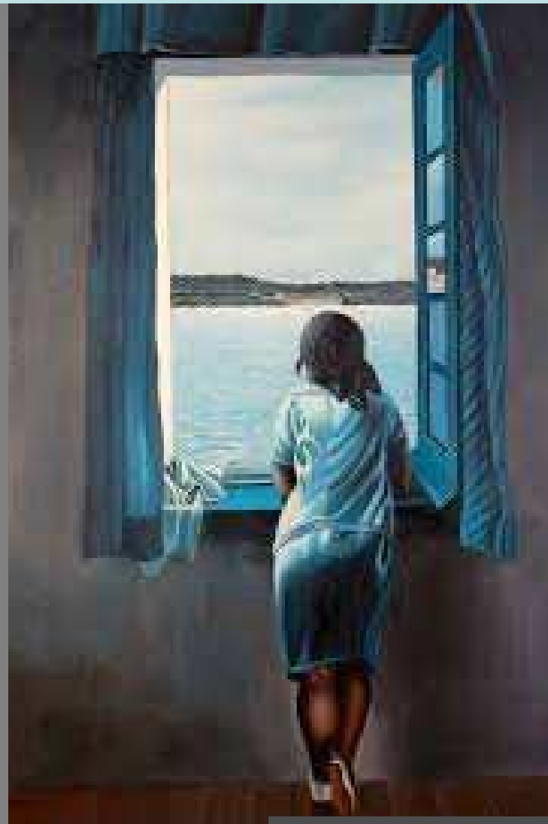
Salvador Dalí 1925