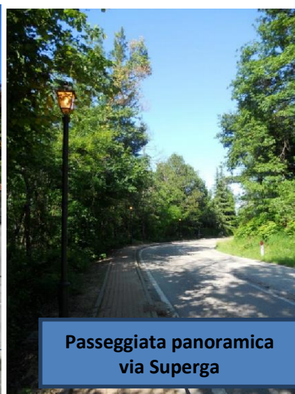
Passeggiata panoramica via Superga