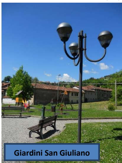
Giardini San Giuliano

Utilizzare corpi illuminanti della tipologia già esistente.