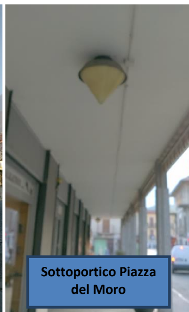
Sottoportico Piazza del Moro