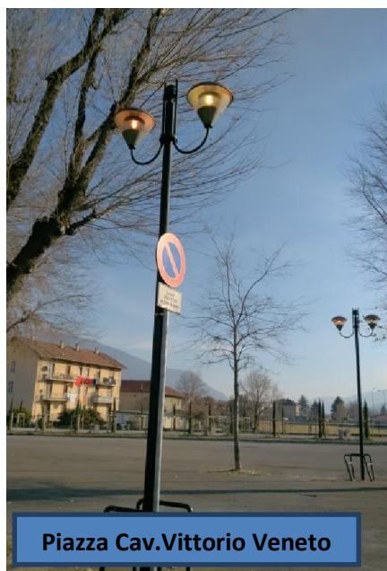
Piazza Cav.Vittorio Veneto

Vincolo paesaggistico esistente sulle borgate Richettera e Argiassera; mantenere lo stato attuale dell'arredo. Mantenere il design delle lanterne esistenti per le altre situazioni (lungo Dora Gastaldi, piazza Cav.Vittorio Veneto) o delle lampade esistenti (sottoportico piazza del Moro).