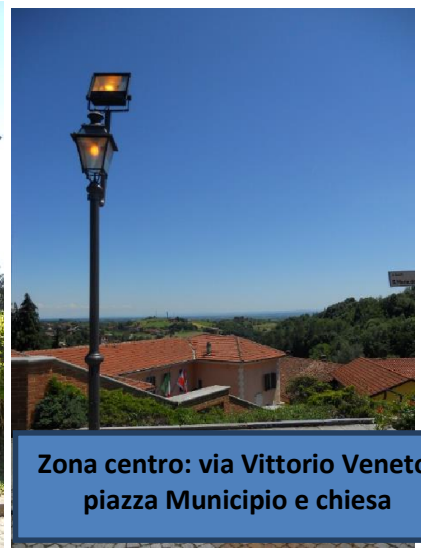
Zona centro: via Vittorio Veneto, piazza Municipio e chiesa