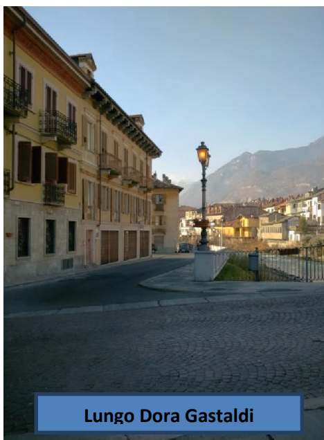
Lungo Dora Gastaldi