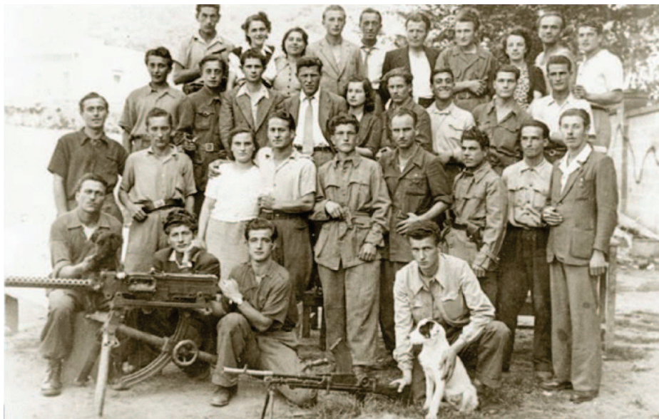
Alcuni partigiani della 114° Brigata Garibaldi