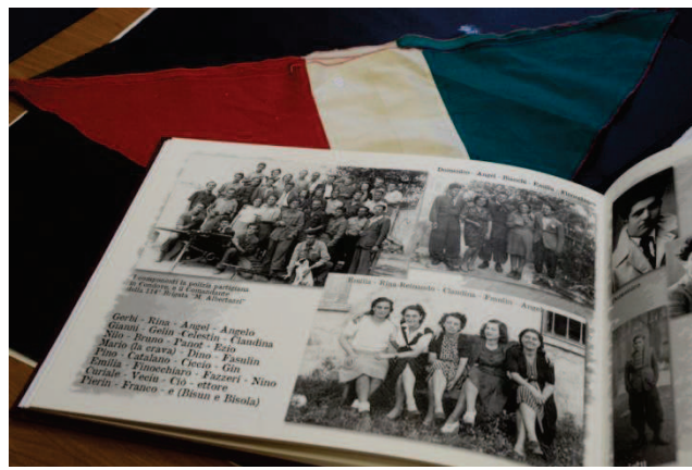
All'interno del nuovo Museo della Resistenza