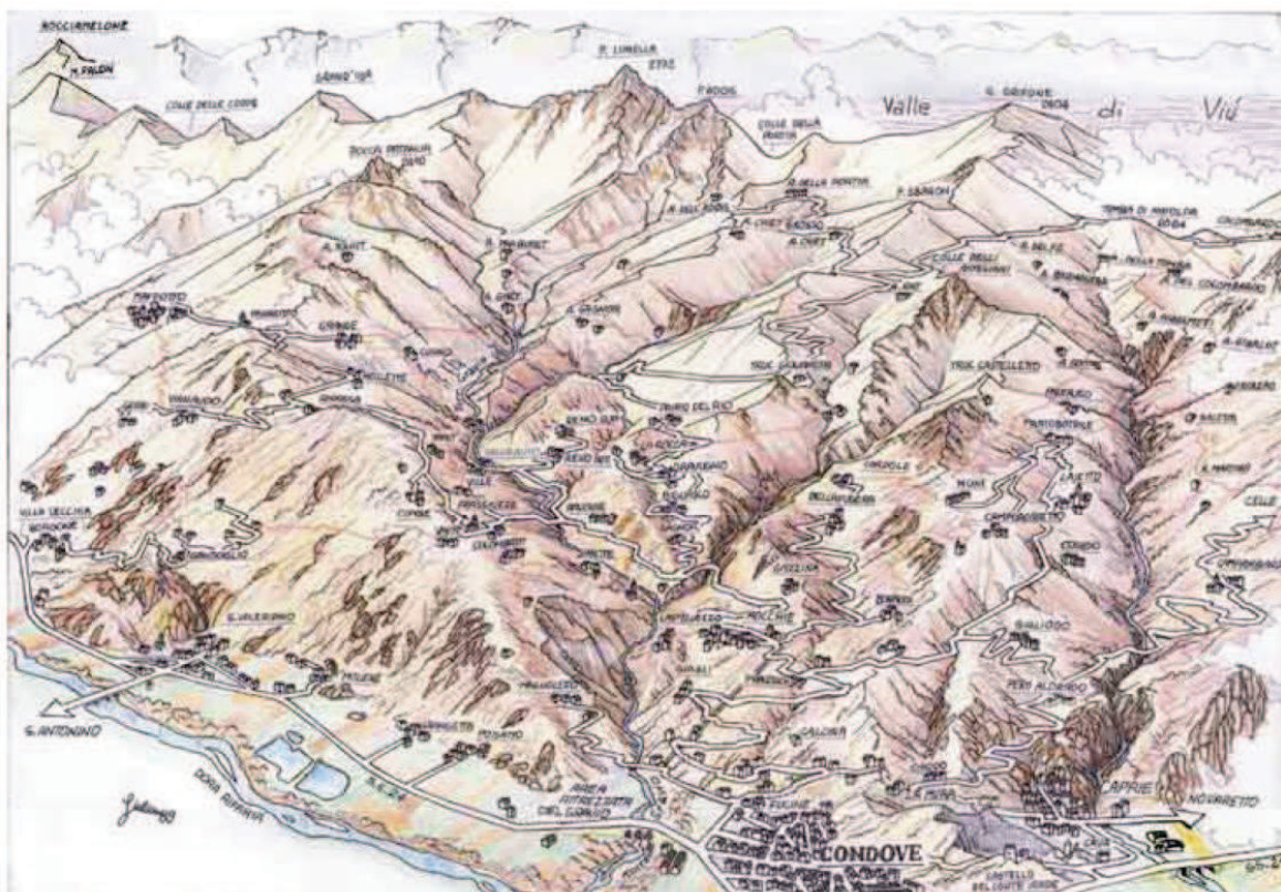
Condove e le sue borgate (disegno E. Giuliano)

Nel 1943 il comune di Condove - situato in Val Susa a 30 km da Torino e in direzione del confine con la Francia - contava circa 5.500 abitanti, tra il capoluogo di pianura e 72 borgate montane sparse su un vasto territorio fino ai 2770 metri della punta Lunella ed ai 2000 metri del Collombardo, valico che unisce la Val Susa con la Val di Lanzo.