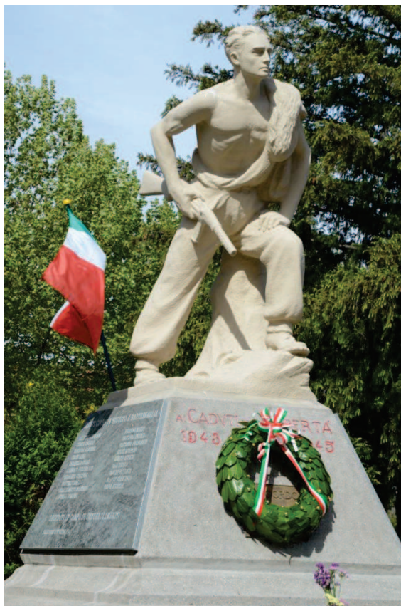
Il monumento dedicato alla Resistenza

Piazza Martiri della Libertà 7 10055 Condove (Torino)