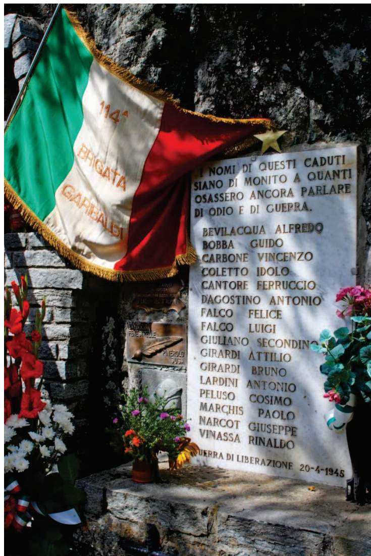
La lapide al monumento di Vaccherezza che ricorda i 16 giovani partigiani trucidati durante il rastrellamento del 20 aprile 1945

20 aprile - Mille fra alpini della "Monterosa" e truppe naziste, effettuano una massiccia azione di aggiramento salendo dalla Val Gravio, arrivando dal Colle della Portia e dalla valle di Viù, bruciando gli alpeggi. Il tutto mentre altre due brigate partigiane la 113 a e la 27 a avevano sguarnito la zona ed erano già in viaggio verso il piano, per l'attacco finale a Torino, lasciando la montagna scoperta. E nella conca di Vaccherezza a 1500 metri - dopo una giornata di battaglia - 16 patrioti perdono la vita: altri 12 vengono fatti prigionieri e portati a Susa . Proprio alla vigilia della Liberazione.