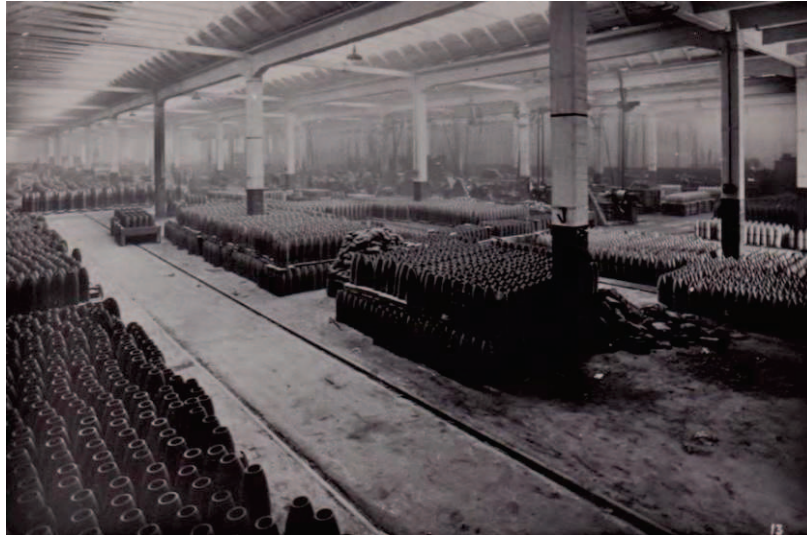
Produzioni belliche presso gli stabilimenti Moncenisio

meze e sono in contatto con i partigiani, dove vi sono diversi nostri disertori". Infatti nei turni di notte gli operai riparano le armi dei patrioti e di giorno sabotano i mezzi tedeschi in riparazione. Inoltre il personale impiegatizio dell'azienda non si mostra collaborativo col comando tedesco.