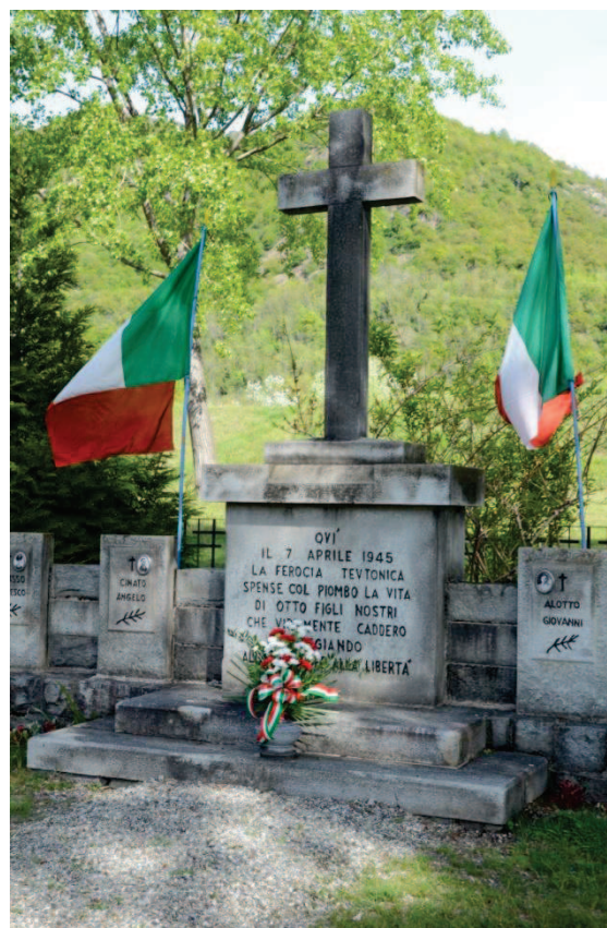
Il monumento dedicato ai martiri civili del Gravidio