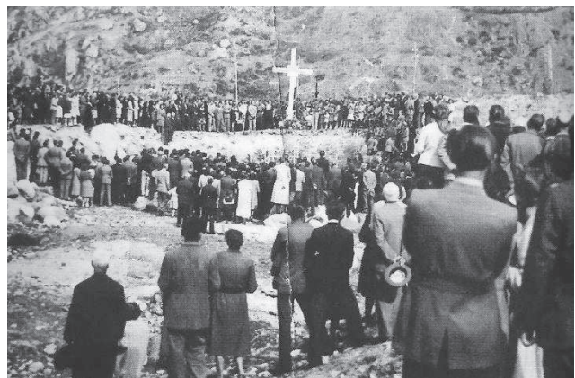
A sinistra, il monumento dedicato agli 8 civili fucilati il 7 aprile 1945. A destra, la prima commemorazione dei civili avvenuta il 1° maggio 1945.

10 aprile - Alba di battaglia a Rocca, Prato del Rio e Reno superiore e valloni circostanti. Truppe tedesche e fasciste, rinforzate da artiglieria e squadre di mortaisti attaccano i distaccamenti in una giornata di tremende sparatorie che mettono a dura prova i partigiani condovesi, con diversi patrioti feriti. Ma gli assalitori temendo la notte, alla sera si ritirano in fondo valle.