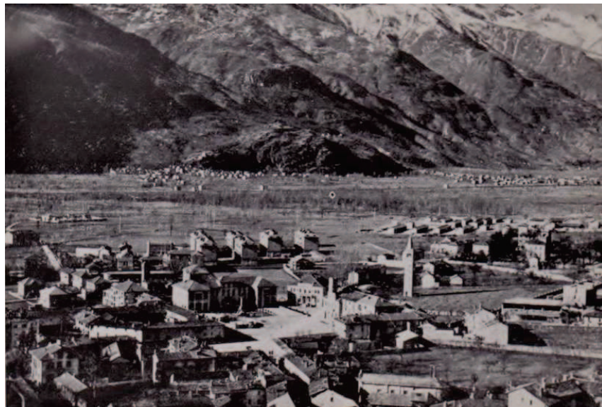
Veduta di Condove negli anni della Guerra: in alto a destra le Casermette militari

Nell'abitato di fondovalle alcune caserme militari erano occupate da 800 uomini del "Genova Cavalleria".